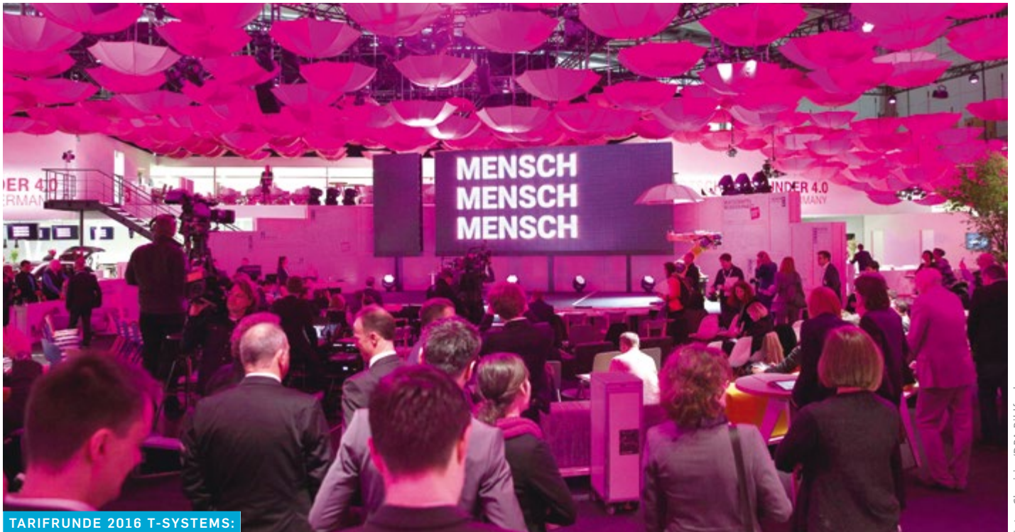
TARIFRUNDE 2016 T-SYSTEMS: