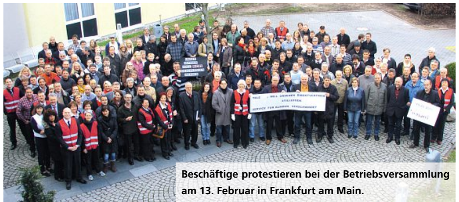
Beschäftigte protestieren bei der Betriebsversammlung am 13. Februar in Frankfurt am Main.

Redaktionsschluss befand sich der Betriebsrat noch in den Verhandlungen, um die Beschäftigten bestmöglich vor den negativen Folgen der Schließung zu schützen. Betriebsbedingte Beendigungskündigungen sind ausgeschlossen. Die geplante Schließung zum 31. März 2013 konnte aufgrund des straffen Zeitplans nicht eingehalten werden, über den endgültigen Termin wird mit der T-Direkt noch verhandelt. Rebecca Munko