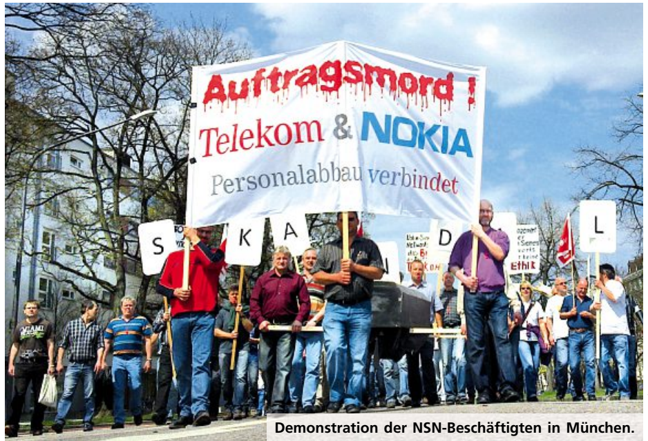
Demonstration der NSN-Beschäftigten in München.

Nokia Siemens Network (NSN) gab Ende letzten Jahres Pläne bekannt, seine Service-Tochter (NSN-S) bis spätestens Ende 2013 schließen zu wollen. Mit der Schließung würden rund 1000 Arbeitsplätze wegfallen. Betroffen sind auch viele ehemalige Telekommer. Doch die Beschäftigten und die Gewerkschaften ver.di und IG Metall nehmen diesen Kahlschlag nicht hin und versuchen durch Proteste und Appelle das Management wenigstens zu anständigen Regelungen bei den Interessenausgleichs- und Sozialplanverhandlungen zu bewegen. Jüngste Höhepunkte waren Mahnwachen vor der Telekom-Hauptstadtrepräsentanz in Berlin und vor der Telekom-Zentrale in Bonn.