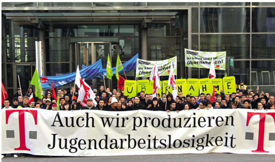
Erfolgreich: Die Beschäftigten der Telekom setzten sich gegen die Pläne des Vorstands durch und erkämpften eine Einigung zur Übernahme von Auszubildenden.

zember 2012 hat ver.di am Verhandlungstisch die Telekom zu einer Einigung bewegt und Beschäftigungsperspektiven für die Jahre 2013 bis 2015 durchgesetzt. Das Ergebnis zeigt, die vom Telekom-Management verfolgten zukunftsgefährdenden Vorstellungen sind vom Tisch. Die Eckpunkte der Einigung sehen wie folgt aus: